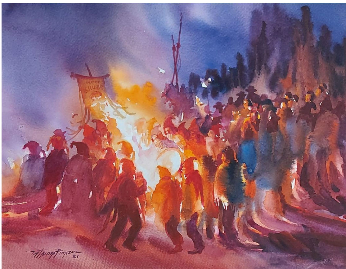
Acuarela del maestro puneño Alcides Catacora Pinazo

A estas alturas, Roberto Sánchez, el candidato respaldado por el expresidente Pedro Castillo está pasando a segunda vuelta, y los resultados parecen irreversibles. Salvo que tengan éxito las tinterilladas y maniobras del fujimorismo y el porkysmo.