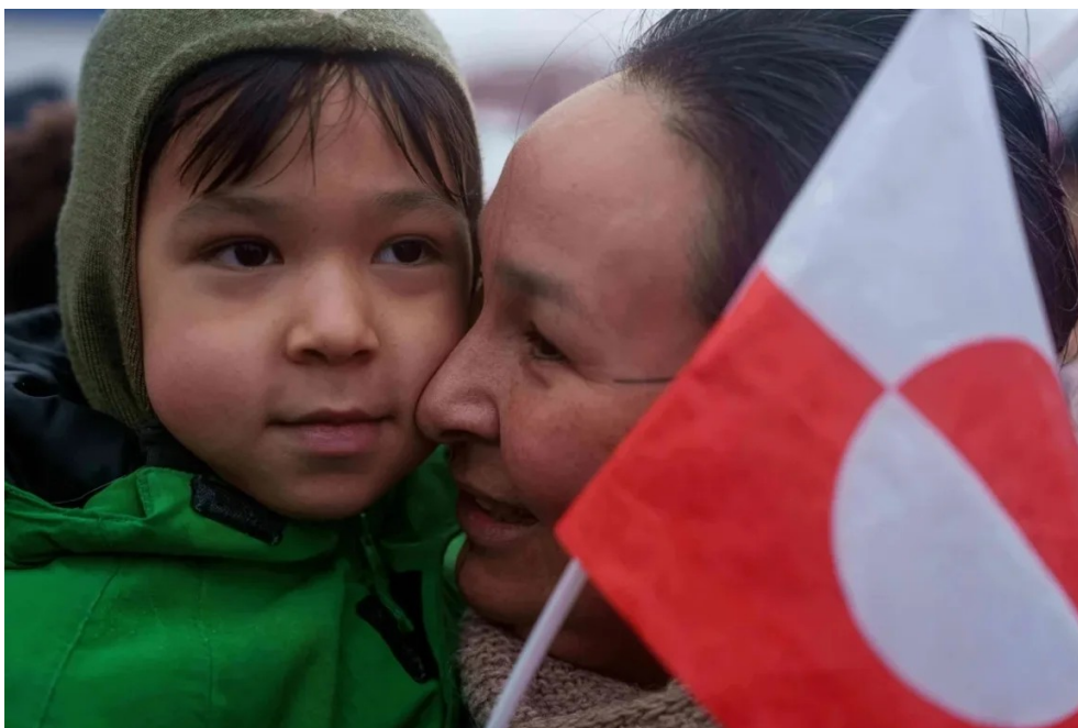
Una mujer inuit sostiene a su hijo durante una protesta frente al Consulado de Estados Unidos en Nuuk, Groenlandia, el 17 de enero de 2026.

¿Por qué Groenlandia es tan importante para Europa?