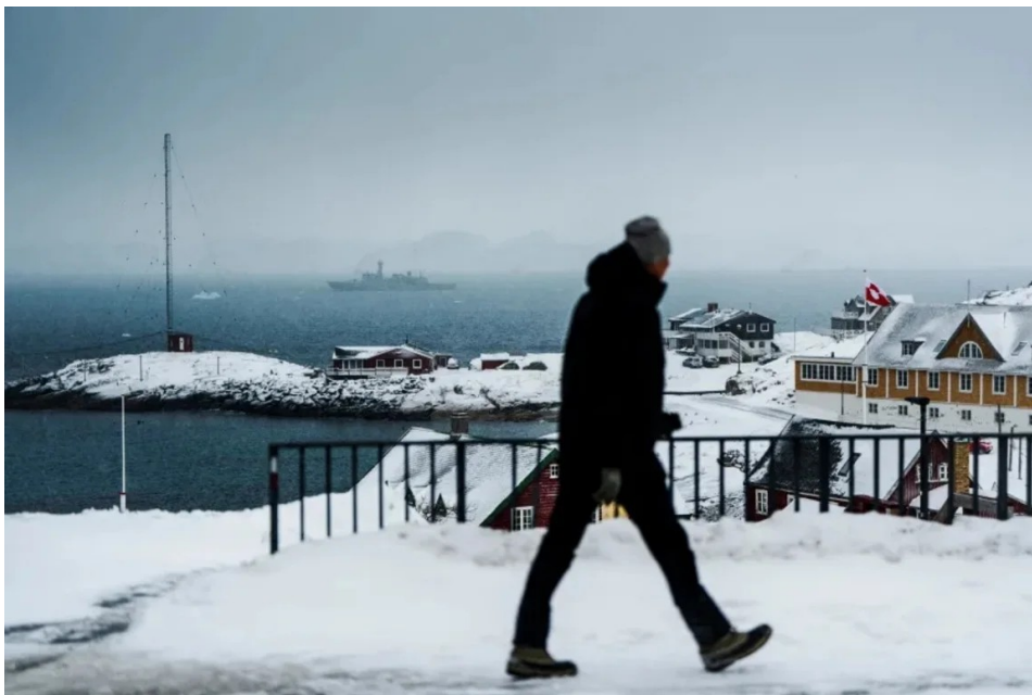
El buque de inspección HDMS Vaedderen de la marina danesa navega frente a Nuuk, Groenlandia, el domingo 18 de enero de 2026.

El vicepresidente del primer mandato de Trump, Mike Pence, dijo a Jake Tapper de CNN en “State of the Union” que, si bien Estados Unidos tiene interés en controlar y, en última instancia, poseer Groenlandia, los métodos de Trump eran contraproducentes. “Creo que la postura actual, que espero cambie y disminuya, sí amenaza con fracturar esa fuerte relación, no solo con Dinamarca, sino con todos nuestros aliados de la OTAN”, dijo Pence el domingo.